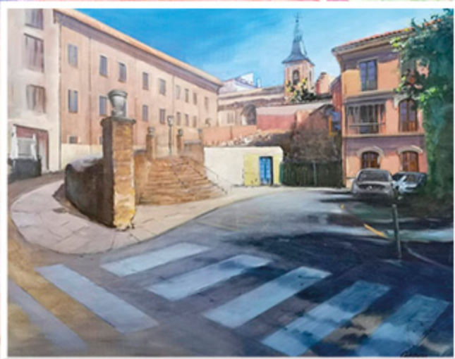
3 er PREMIO 2020 MANUEL CARBALLEIRA