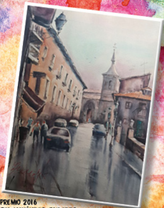
1 er PREMIO 2016 ISABEL MENÉNDEZ IZQUIERDO