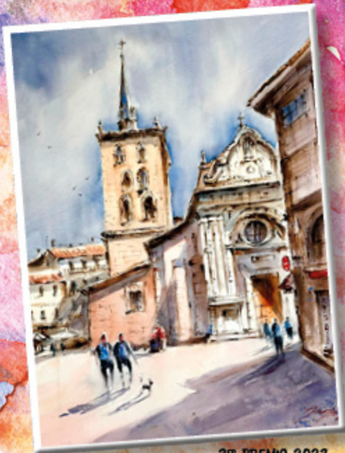
3 er PREMIO 2023 ISABEL MENÉNDEZ IZQUERDO