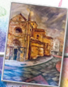
ACCÉSIT, 2015 FRANCISCO ALTIER FERNÁNDEZ