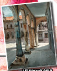
1 er PREMIO 2019 MÁRISOL DE MARCOS MIGUEL