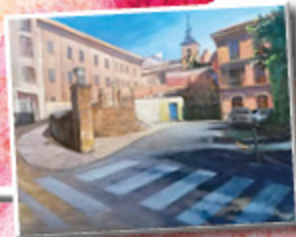
3 er PREMIO 2020 MANUEL CARRALLEIRA