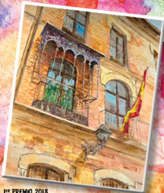
1 er PREMIO 2018 FRANCISCO TOMÁS MEDINA