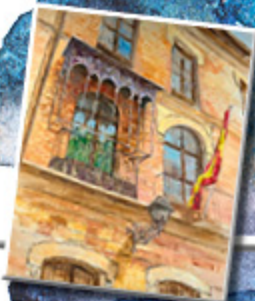
1 er PREMIO 2018 FRANCISCO TOMÁS MEDINA