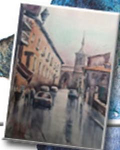
1 er PREMIO 2016 ISABEL MENÉNDEZ IZQUIERDO