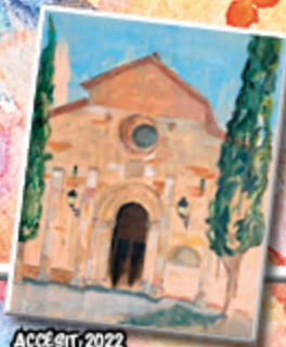
ACCÉSIT, 2022 EVA BLANCO UCERO