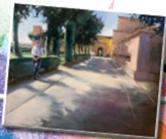
1 er PREMIO 2015 MANUEL CARBALLEIRA