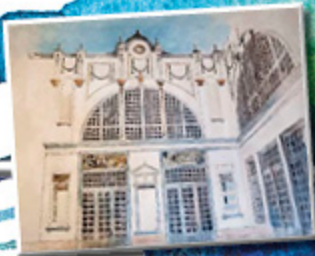
1 er PREMIO 2014 OSCAR NORÁN BLANCO