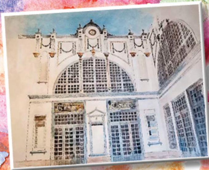
1 er PREMIO 2014 ÓSCAR MORÁN BLANCO