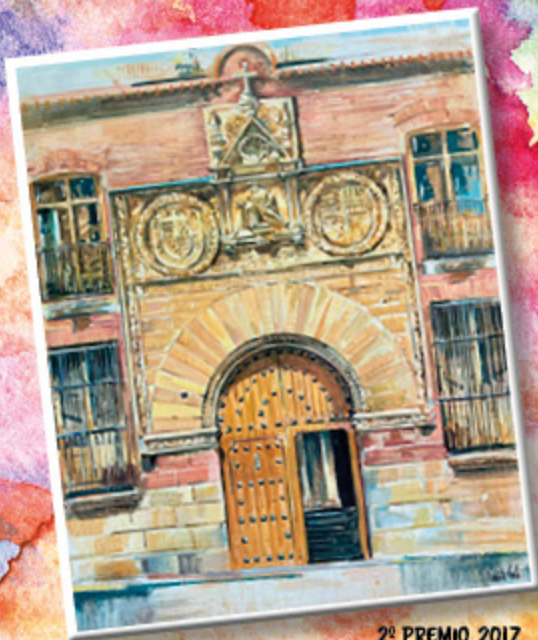
2º PREMIO 2017 VICENTE SOTO FERNÁNDEZ