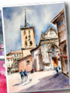
3 er PREMIO 2023 ISABEL MENÉNDEZ IZQUIERDO